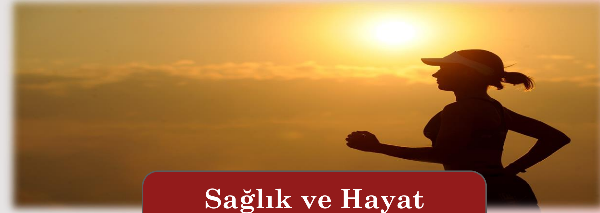
Sağlık ve Hayat Çözümleri