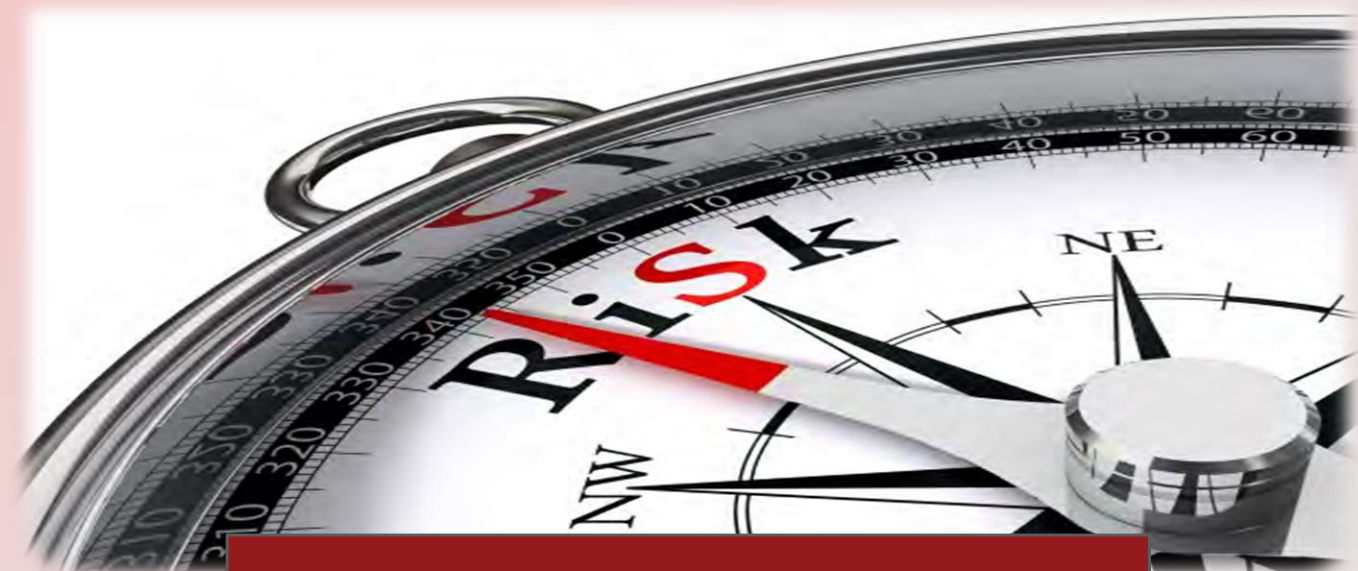
Risk Yönetimi ve Danışmanlıđı